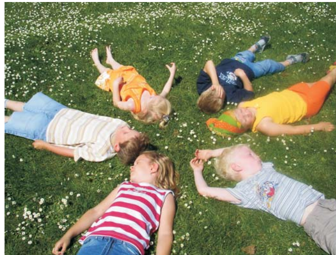
©Plattsacker warten auf den Sommer